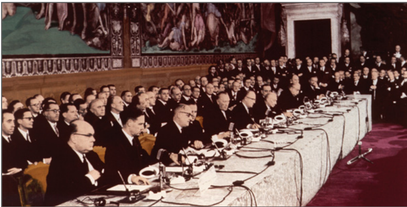
Υπογραφή της Συνθήκης της Ρώμης